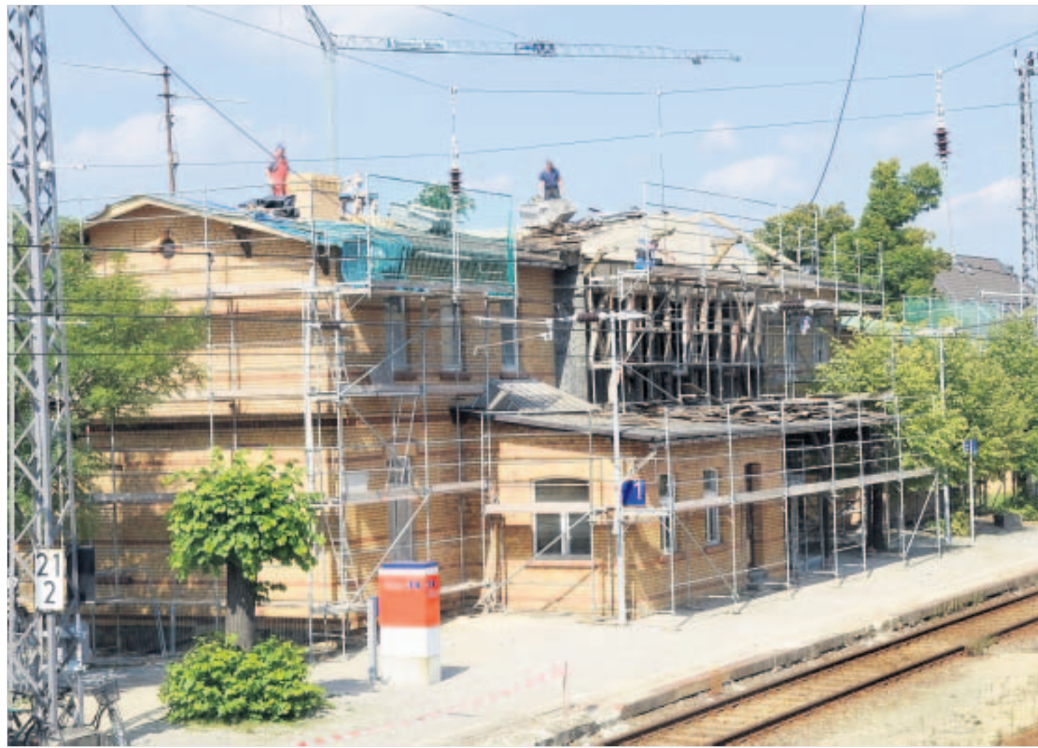
Das Ortrander Bahnhofsgelände war noch bis voriges Jahr in Betrieb. Nun ist es privatisiert und soll Wohn- und Geschäftshaus werden. Ins Erdgeschoss ziehen im nächsten März zwei Allgemeinärzte ein. In die obere Etage kommen drei Büroeinheiten und eine Wohnung.